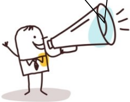
Dépenses de fonctionnement

Les impôts, oui, mais pour des projets utiles et d'intérêt général !